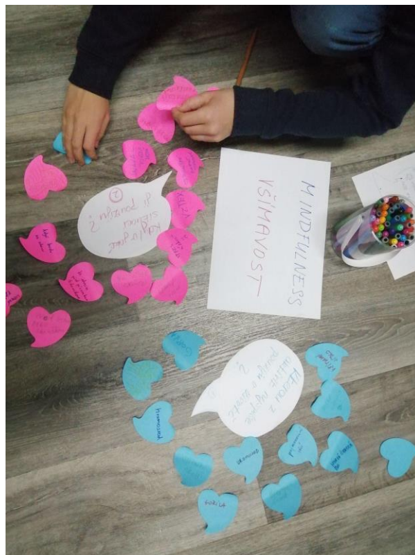
FOTO: Workshop zaměřený na rozvíjení všímavosti a práci s emocemi pro mládež, studentský klub Malostranská, Praha 1